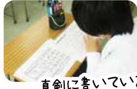
真剣に書いています

字を書くことが好きな人、字が上手くなりたくい人、字を書くことが苦手な人、集まれ！自分のノートはもちろん、履歴書や手紙、年賀状を書くときに役立ちます。