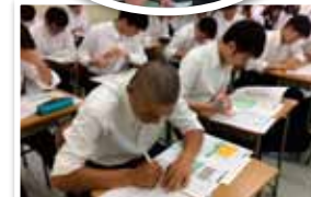
3年目になるココカラ検査